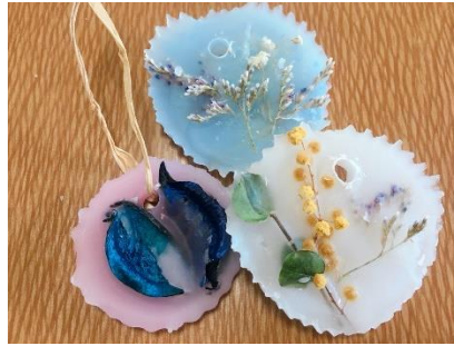
① b.アロマワックスバー